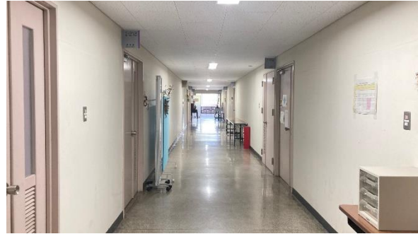
อาคารหมายเลข 2