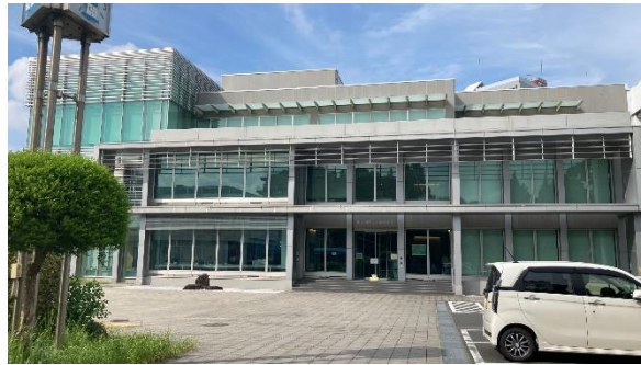
ห้องสมุด

ห้องสมุดนั้นใหม่และสวยงามมาก มีทั้งหมด 3 ชั้น ชั้น 1 จะแบ่งเป็นบริเวณที่สามารถรับประทานอาหารได้กับบริเวณที่ไม่สามารถรับประทานอาหารได้ แต่สามารถส่งเสียงพูดคุยได้ ส่วนชั้น 2 กับชั้น 3 เป็นโซนเงียบ นักเรียนแลกเปลี่ยนมักจะมาอ่านหนังสือตัวสอบกันที่นี่