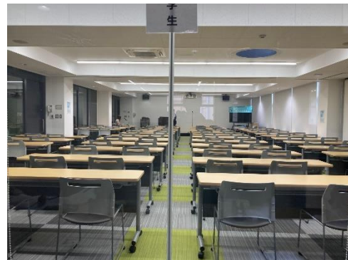
โรงอาหาร