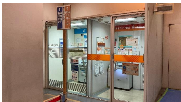
อาคารหลัก