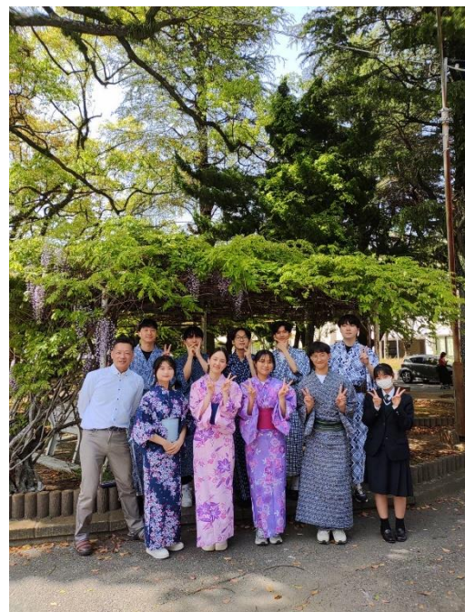
รูปกิจกรรมวิชาวัฒนธรรมญี่ปุ่น